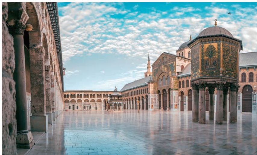
Umayyad Mosque, Damascus, Syria

Planned Research Group A03 conducts research mainly through fieldwork and documentary surveys on the specific topics of “community formation of Muslim migrants in Japan, Europe, the United States and Southeast Asia, and relationships with the host societies,” “connectivity among migrant communities in relation to refugee assistance,” and “initiative and influence of migrants and refugees in international politics.” The broad theme of this group is the building of mutual trust and relationships between Muslims and non-Muslims within the issues of large-scale migration and refugees in modern times.